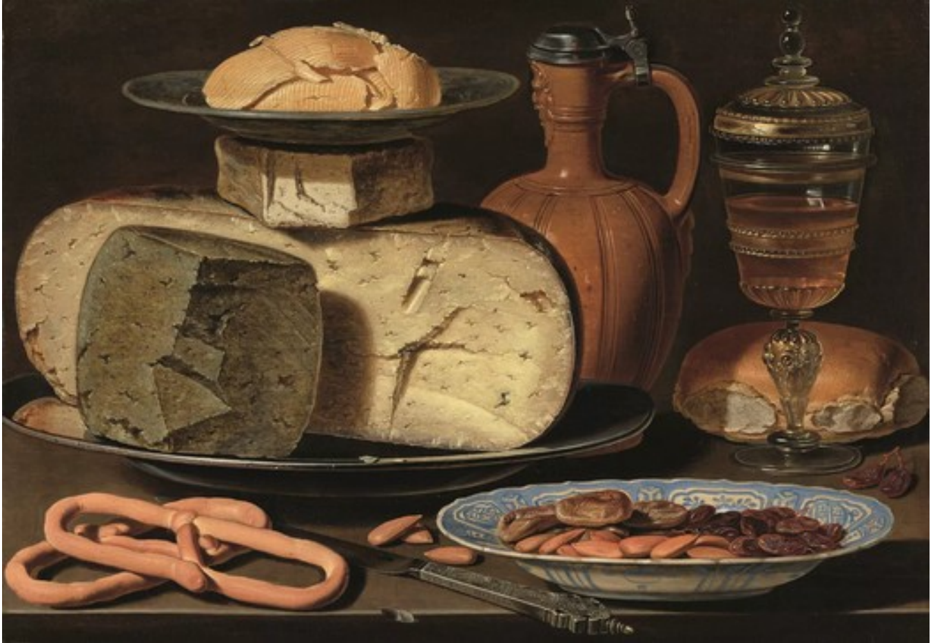
'Stilleven met kazen, amandelen en krakelingen', Clara Peeters, 1615.

ontvangt het Mauritshuis samen met het Rijksmuseum, het Van Gogh Museum en het Kröller-Müller Museum elk jaar 7,5 miljoen euro voor kunstaankopen. 'Het is een vijfjarige afspraak, dus wij kunnen er niet van uitgaan dat het geld er voor altijd zal zijn. Voordeel is dat je de gelden van jaar tot jaar mag opsparen. Met dat geld kunnen we verdere financiering zoeken om de collectie te finetunen.'