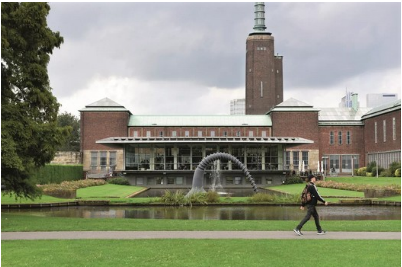
Het Boijmans Van Beuningen Museum in Rotterdam (sinds 1849)

Dat Gordenker niet met een boedellijstje naar Tefaf afreist, betekent niet dat het Mauritshuis nooit iets aankoopt. Gemiddeld schaft het museum jaarlijks toch een à twee nieuwe stukken aan. 'Als museum móét je aankopen vind ik, anders wordt je collectie statisch. Van aanwinsten kun je tentoonstellingen maken. We lenen daarnaast graag werken uit aan andere musea en daarvoor heb je wisselstukken nodig.'