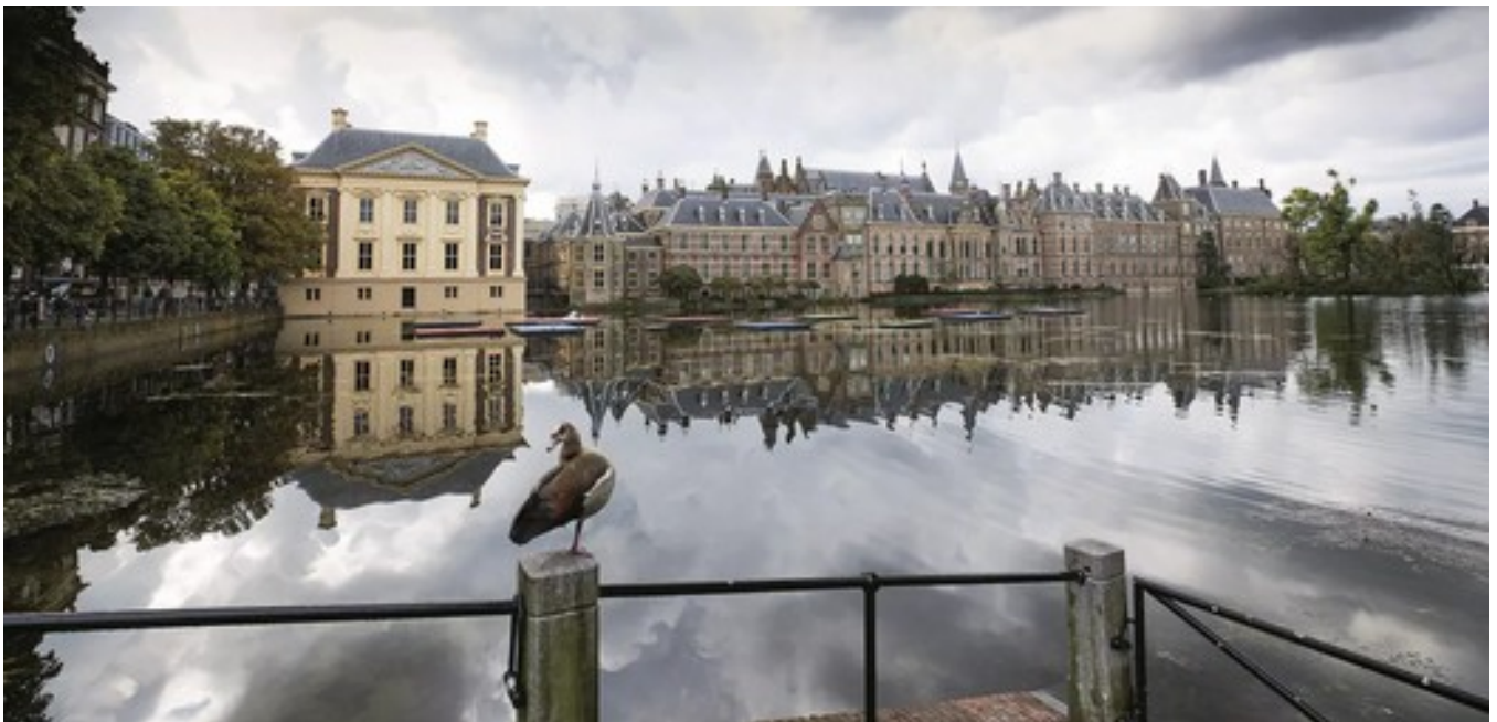
Het Mauritshuis in Den Haag, sinds 1822 een kunstmuseum

Jaarlijks heeft Driessen ongeveer een half miljoen euro te besteden, een beperkt budget gezien de huidige kunstmarkt. 'Een aantal kunstenaars kunnen wij niet blijven volgen, omdat ze te duur zijn geworden. Maar reputaties zijn vaak een gevolg van marketing. Daardoor moet je je als museum niet laten misleiden.'