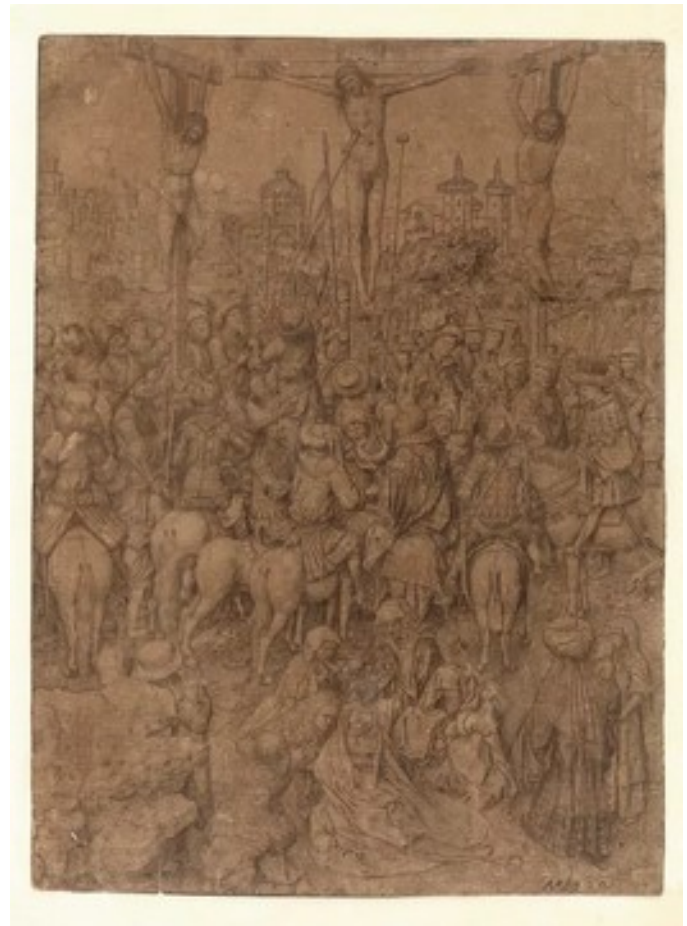
'Kruisiging van Christus', Jan van Eyck, ca. 1440-1450