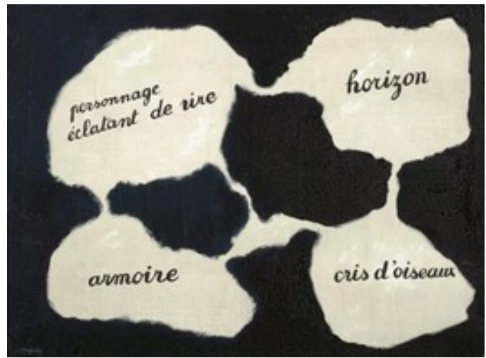
'Le Miroir Vivant-3', René Magritte, 1928.