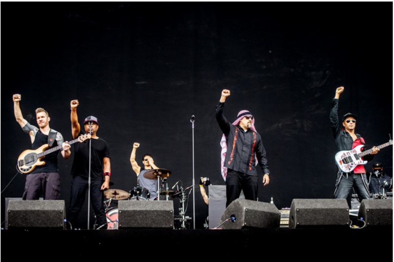
Prophets of Rage tijdens hun passage op Rock Werchter

In een hotel in Frankfurt legt Chuck D (Carlton Ridenhour) uit dat de Prophets een stem willen geven aan de onderdrukten in de Verenigde Staten, die door het hyperkapitalisme zijn murw gebeukt. Met een logge bas, een roestige gitaar en drums als mitrailleurvuur vertelt 'Living on the 110' over de daklozen die hun intrek hebben genomen onder een snelweg in Los Angeles. 'Strength in Numbers' stelt dat we met z'n allen sterker staan dan alleen en 'Hail to the Chief' is een rechtstreekse aanklacht tegen Trump en consorten. Criminalisering van immigranten, radicalisering, een almaar scherpere tweedeling tussen arm en rijk; genoeg om je over op te winden in een met grove streken geschetste Trumpiaanse dystopie.