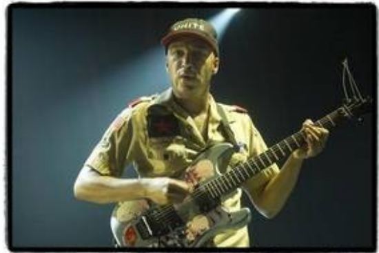
Tom Morello was de man die Chuck D warm maakte voor Prophets of Rage

"Toen Tom Morello mij benaderde voor Prophets, was mijn vader net overleden. Ik had het gevoel dat ik iets anders moest gaan doen. Een grote missie tegen wat er mis is in dit land. Niets ten nadele van Public Enemy, en het hoge niveau waarop we opereren, maar met deze combinatie van rock en hiphop, met de kracht van Rage Against the Machine erbij, kunnen we meer mensen bereiken."